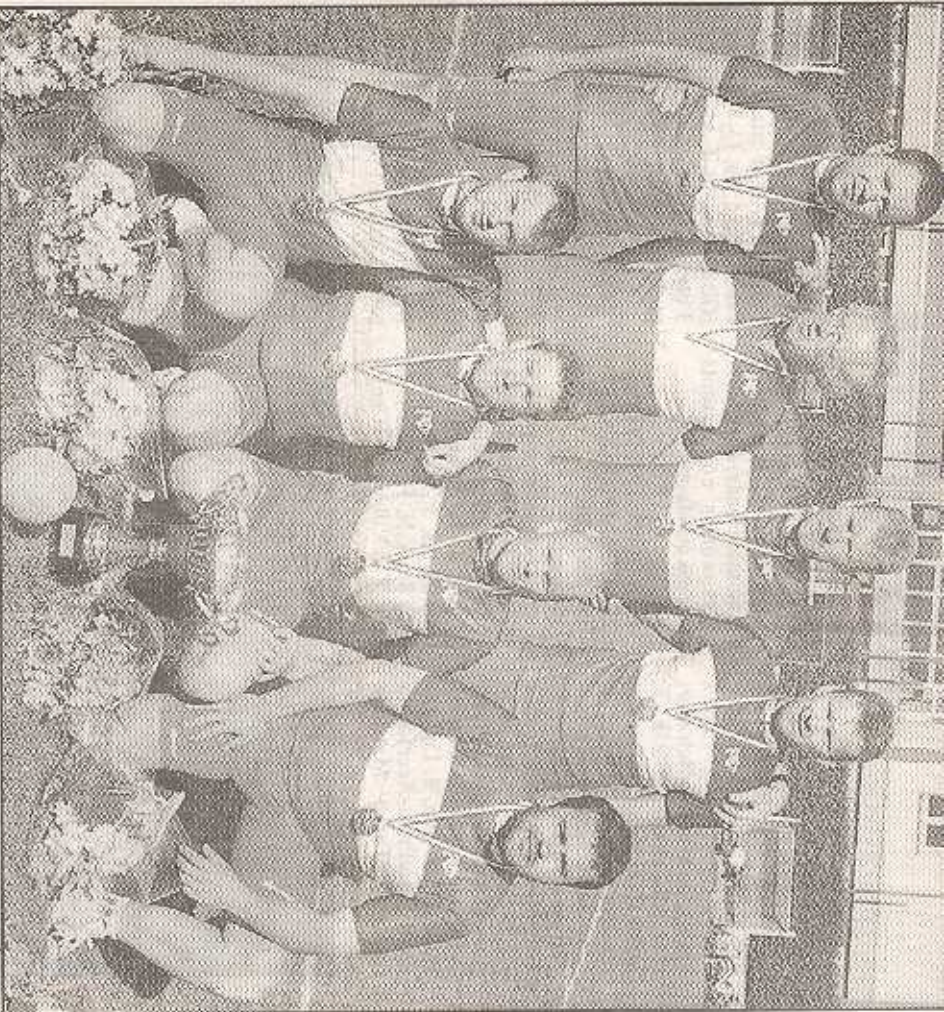
Médaille autour du cou et maillot tricolore sur le dos, les joueurs du VC Frileuse-Sanvic sont une nouvelle fois champions de France