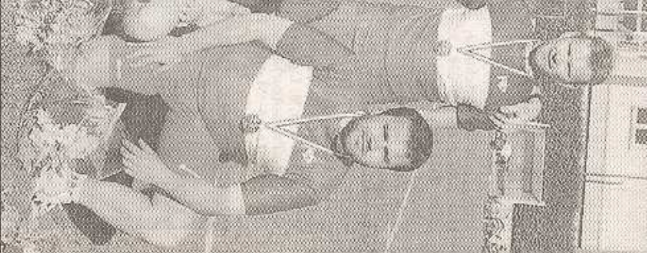
joueurs du VC Frileuse-Sanvic et France